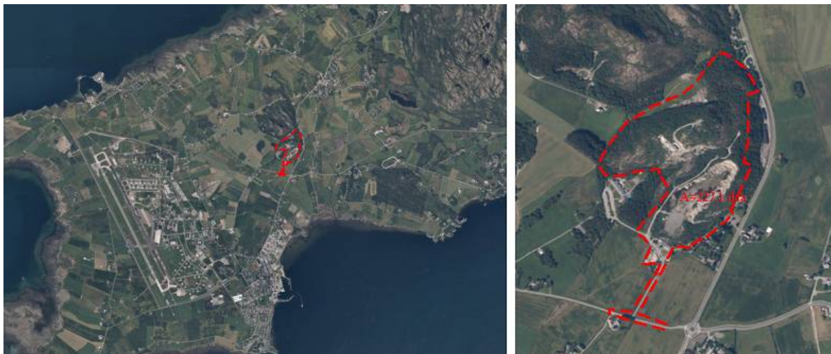
Planområdets beliggenhet og avgrensning

Planinitiativet inneholder en beskrivelse av planområdet, redegjørelse for virkninger av planinitiativet, samt vurdering av hvilke temaer som skal utredes. Varslingsgrensen er på ca. 227 daa.