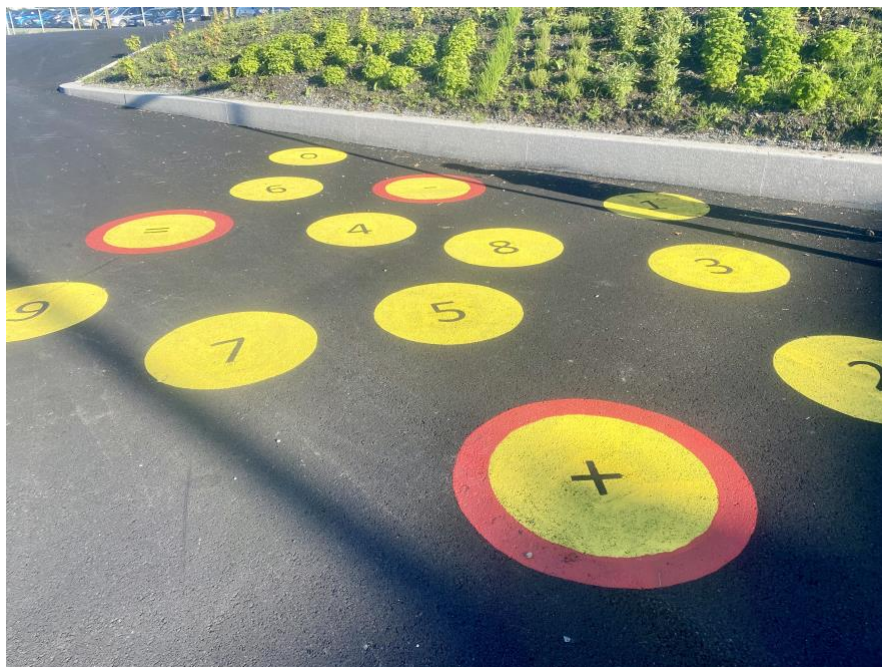
Matematikk i skolegården ved nye Botngård ungdomsskole

Gjensynsgleden er stor når små og store møtes igjen etter en lang sommerferie, og det er alltid ekstra stas å ta imot våre nye barn i barnehage og på skolen.