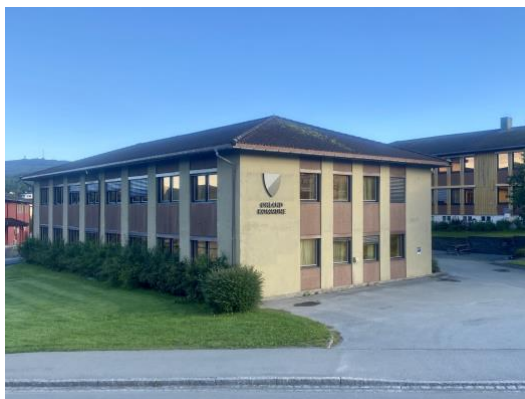
Det gjenstår fortsatt noen flytteprosesser for ansatte.

Det har vært gjennomført møter med tillitsvalgte, og ledere for de forskjellige enhetene og de siste brikkene med bruk og tilpasninger av bygget er nå i ferd med å legges. Flytteprosessene for de forskjellige enhetene forventes startet i løpet av september.