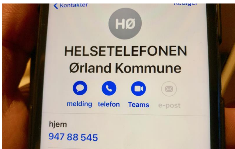
Etter en sommerpause er helsetelefonen på nytt operativ.

Det vurderes jevnlig fra sentralt hold hvilke land som regnes som «røde» og hvor det er karanteneplikt på 10 dager etter hjemkomst, og hvilke land som regnes som «gule» land. Dersom reise til utlandet blir gjennomført må ansatte som har reist til «gule» land ikke nødvendigvis i karantene (se egne karantenereregler ved FHI) men gjennomføre koronatest. Testsvar må foreligge som negativ før jobbstart. Test 2 gjennomføres femte dag etter